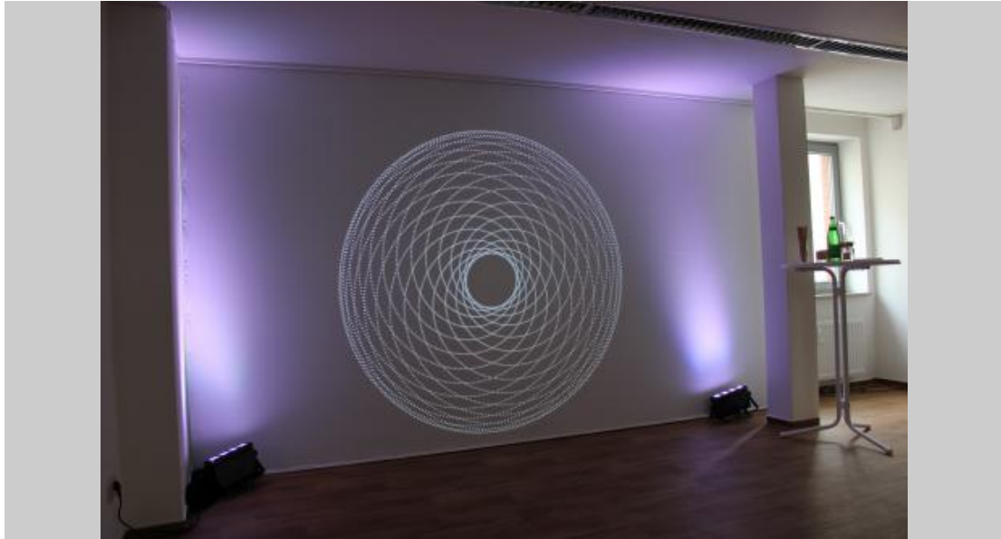
Pashmin Art Gallery Hamburg 2017, Lichtorgelkonzertpremiere Werkstatt Atmani, © PAG Hamburg